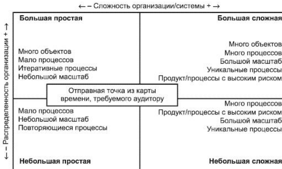
Рисунок С.1 - Потенциальное влияние аддитивных и субтрактивных факторов на время, требуемое аудитору