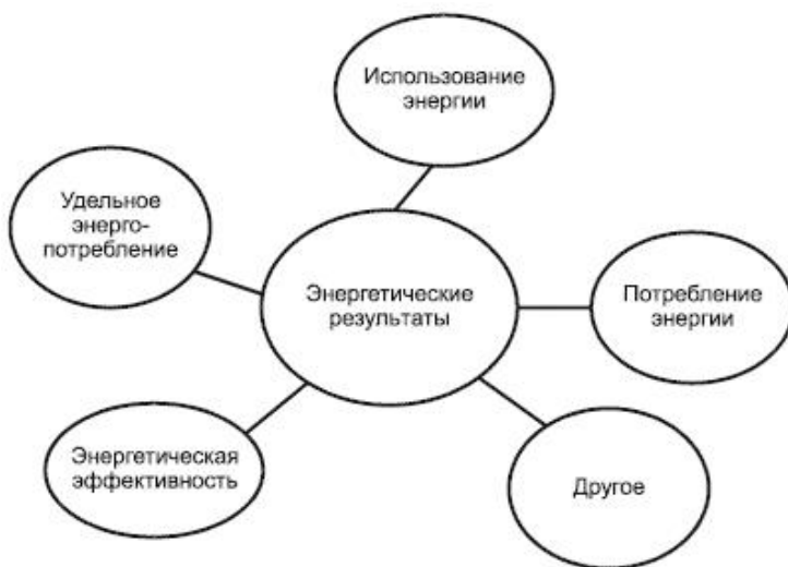
Рисунок А.1 - Концептуальное представление энергетических результатов