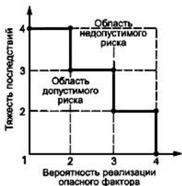
Рисунок Б.1 - Диаграмма анализа рисков